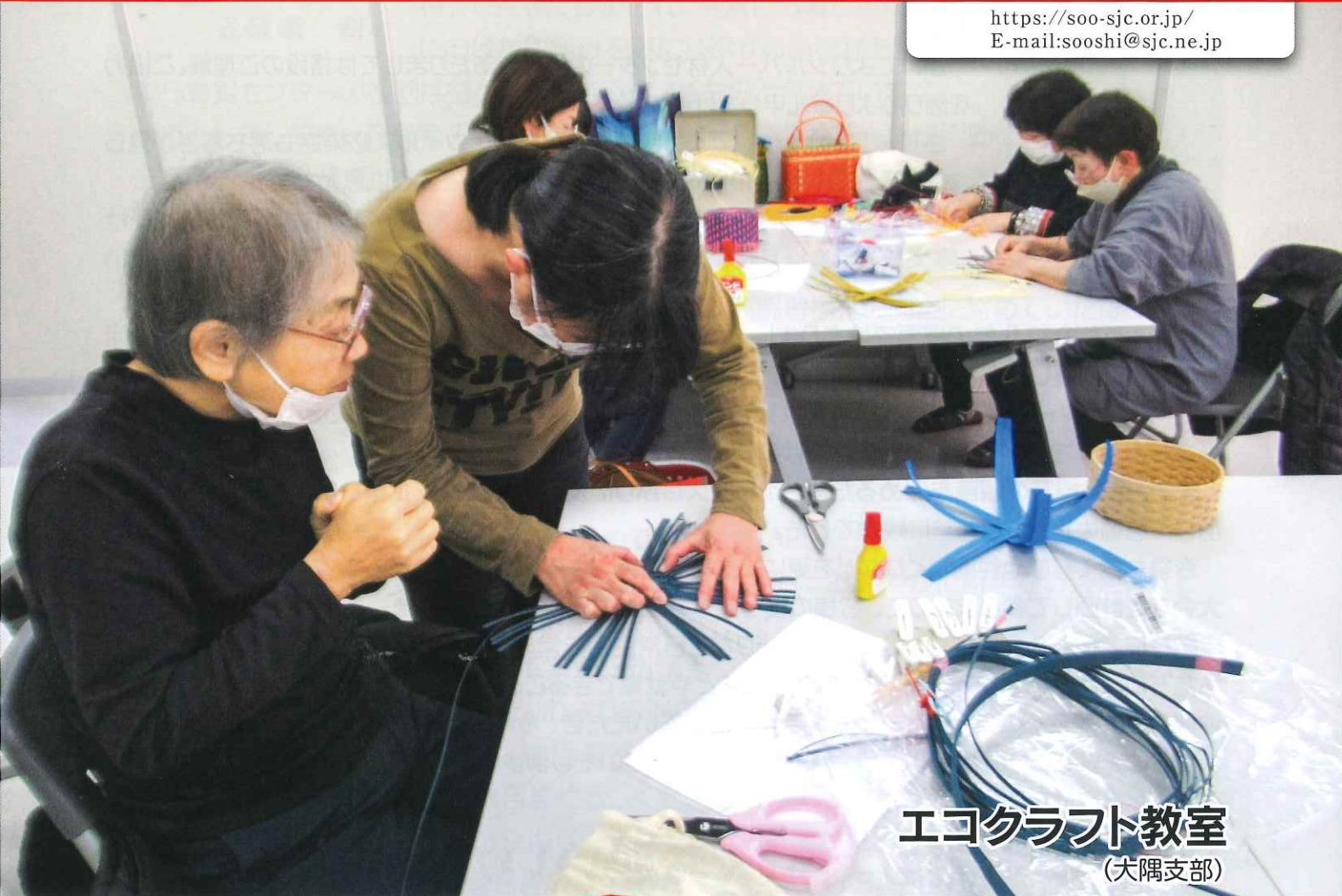
エコクラフト教室 (犬隅支部)

https://soo-sjc.or.jp/ E-mail:sooshi@sjc.ne.jp