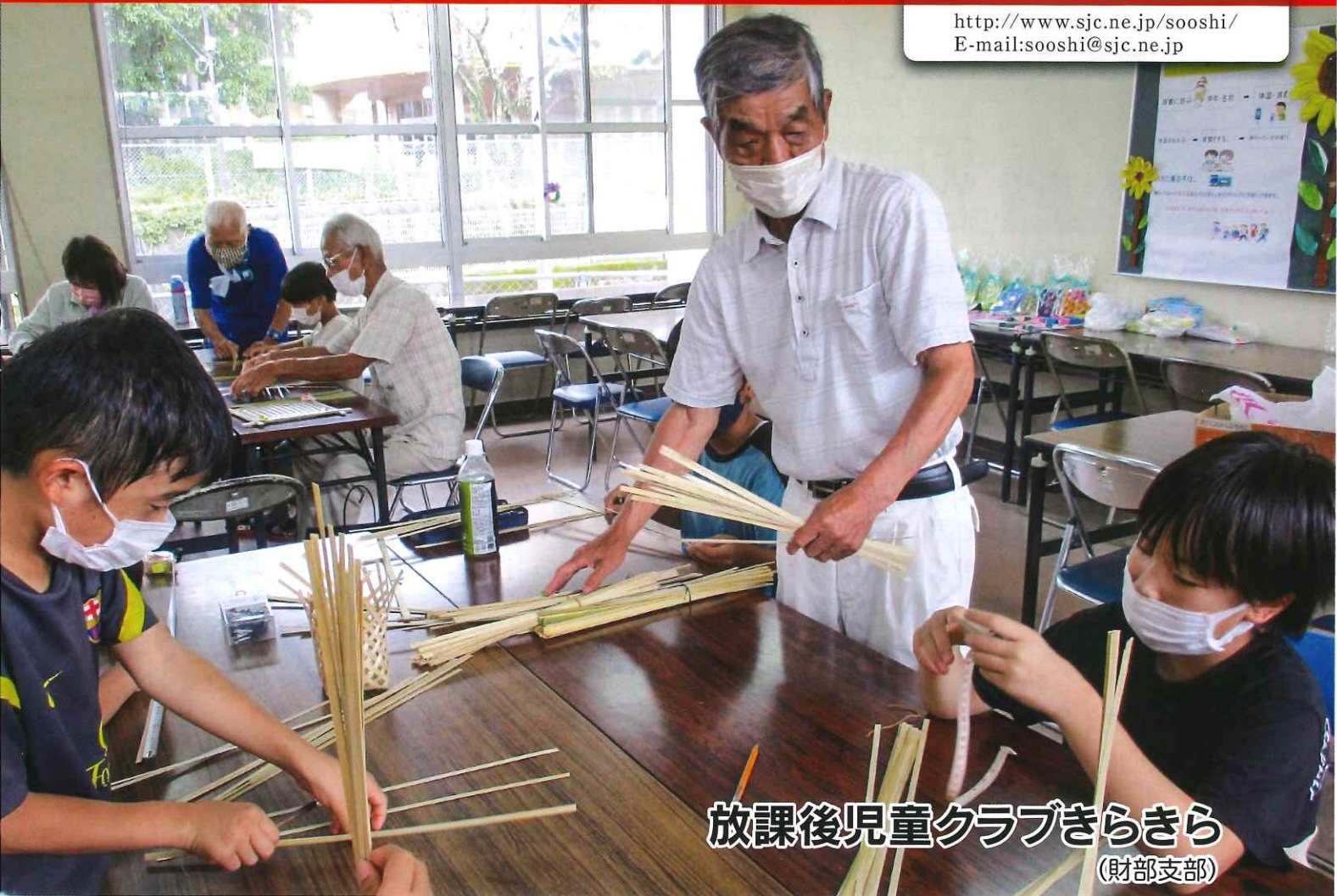
放課後児童クラブきらきら (財部支部)

http://www.sjc.ne.jp/sooshi/ E-mail:sooshi@sjc.ne.jp