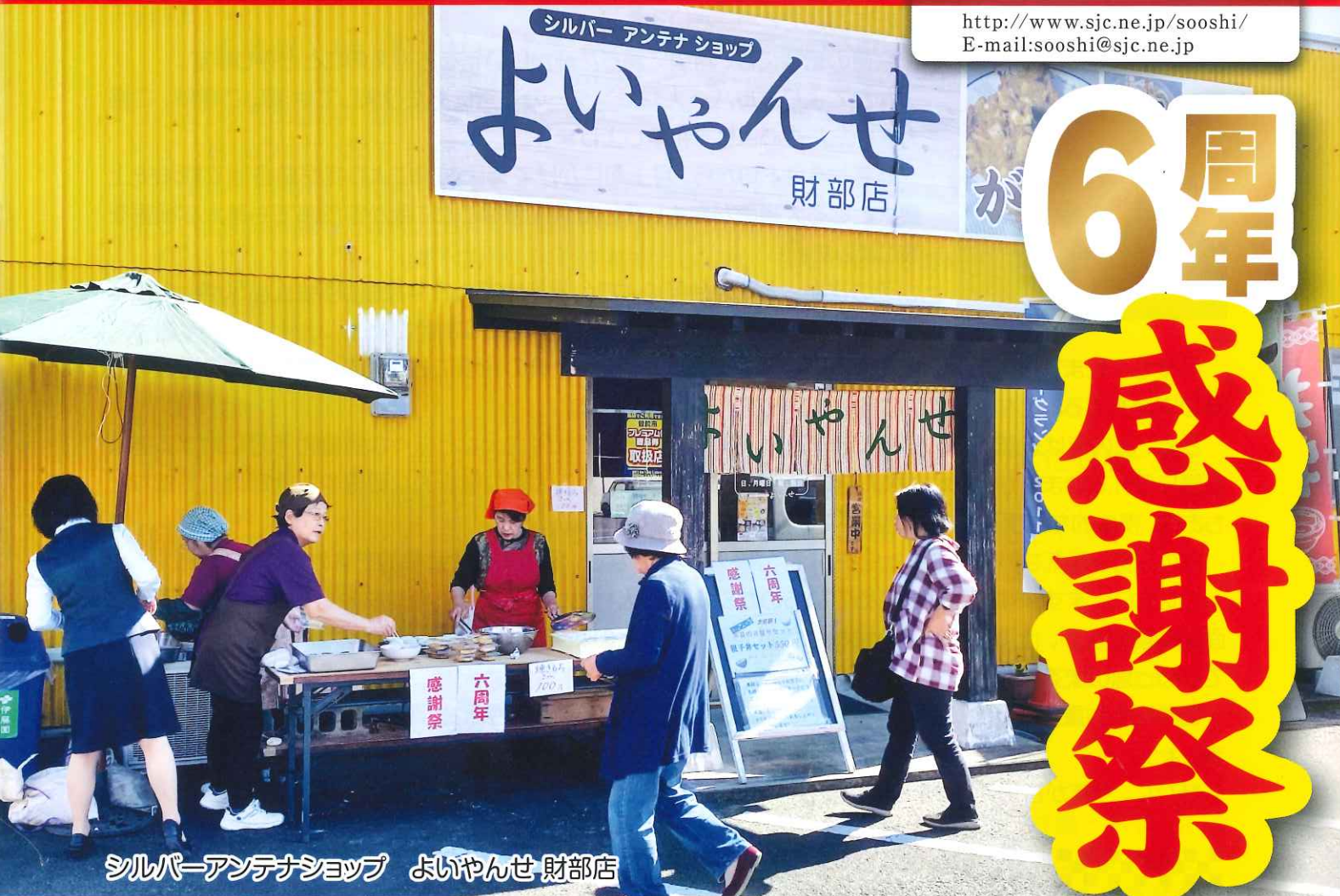
シルバーアンテナショップ よいやるせ 財部店

http://www.sjc.ne.jp/sooshi/ E-mail:sooshi@sjc.ne.jp